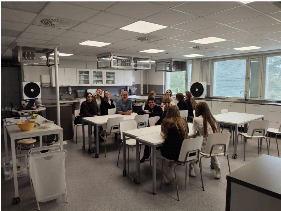
Aula de cocina