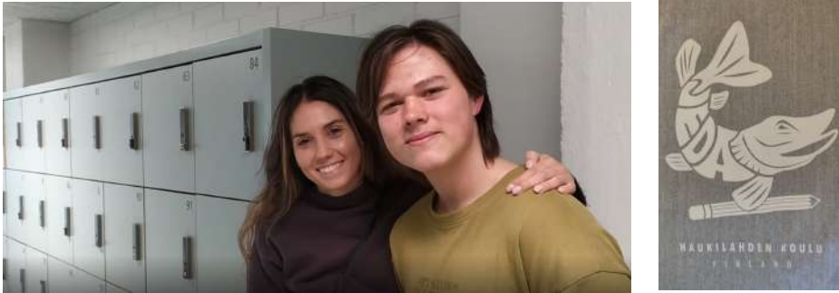
Detalle logo sudadera y detalle de las taquillas a disposición del alumnado

Nos enseñan además las sudaderas que hace el centro con el logo del centro.